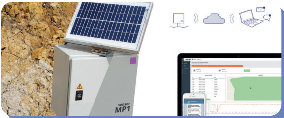
SISTEMA DE AUSCULTACIÓN BASADO EN IOT