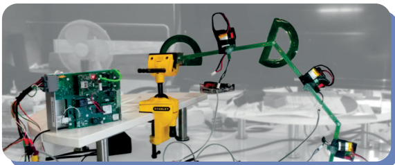
SISTEMA DE GUIADO DE MAQUINARIA