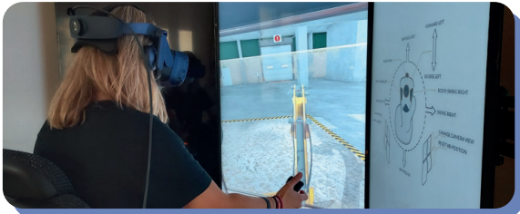
SIMULADOR DE EXCAVADORA EN VR